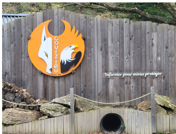
Informez pour mieux protéger est la devise du parc animalier de Courzieu (69).

Pour sensibiliser le public à la présence du loup, il existe des parcs animaliers pour apprendre à mieux connaître cet animal, comme celui de Courzieu (69), où il tient le rôle d'ambassadeur de son espèce. Monsieur Chantoin, soigneur, poursuit : "les rôles des parcs zoologiques sont pédagogiques. Ils participent à la conservation des animaux sauvages. Il faut casser les croyances sur le loup. Nous montrons comment fonctionne le loup. Nous ne sommes pas anti ou pro loups. Nous exprimons des faits scientifiques. Avec un peu de chance, les personnes vont peut-être changer d'avis."