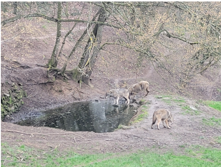
Le parc animalier de Courzieu (69) reproduit au mieux l'espace naturel du loup gris que le visiteur peut observer.

Le loup est revenu en France depuis 1992 en passant par les Alpes depuis l'Italie après avoir disparu de notre territoire dans les années 1930. Le retour du loup a effrayé une partie de la population. Son image est mauvaise à cause de certains contes et mythes. Il est vrai que le