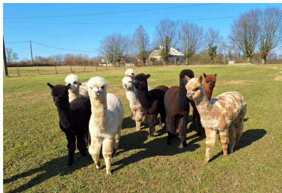
Les camélidés de la ferme

En effet, l'alpaga abîme moins les pâtures que ses homologues ovins à cause de ses sabots renforcés par un coussinet, et n'est pas gourmand en eau. Son système immunitaire pourrait même aider à lutter contre certaines maladies, selon les recherches récentes de l'Institut Pasteur 2 .