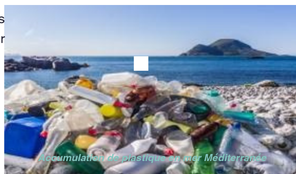
Accumulation de plastique en mer Méditerranée

Chaque année, des milliers de tonnes de déchets plastiques finissent dans la mer Méditerranée. Cette mer semi-fermée figure parmi les zones les plus touchées par la pollution plastique dans le monde. Les courants marins et la forte activité humaine sur les côtes favorisent l'accumulation de déchets qui menacent les écosystèmes marins, la biodiversité et les activités économiques liées à la mer.